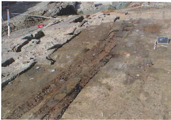
Fig. 2: In situ-verbrande en houtskoolrijke langwerpige "kuilen" of greppels.

grote hoeveelheden pispotten in één beerput laat dan weer vermoeden dat het hier niet gaat om een doorsnee gezin en kan samen met de vondst van 107 loden kogels in een andere beerput mogelijk toegeschreven worden aan het gebruik van het gebouw als legerplaats voor soldaten. Deze bouwfase kan vrij nauwkeurig gedateerd worden tussen 1710 en 1750.