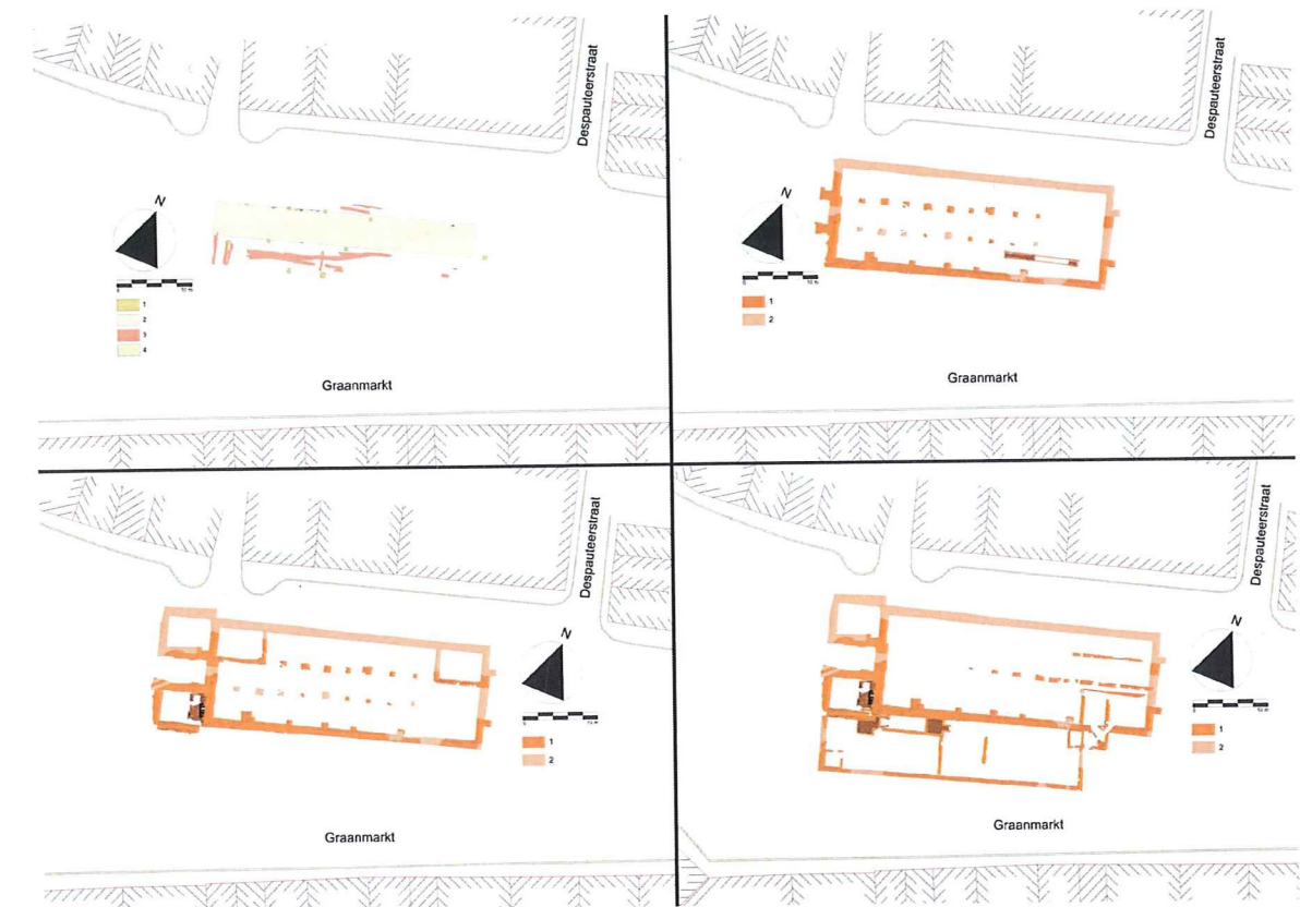
Fig. 1: Fasering van de graanhal: Fase 1: (1) poeren, (2) zandige vulling van de weg, (3) verbrande langwerpige kuilen, (4) restanten van bestrating; Fase 2: (1) constructieresten, (2) reconstructie; Fase 3: (1) constructieresten, (2) reconstructie; Fase 4: (1) constructieresten, (2) reconstructie.

lemen vloeren en de puinlagen met verbrande daktegels binnen de vleugels tonen duidelijk aan dat het gebouw verschillende malen moet afgebrand zijn. Niet alle brandsporen kunnen hier evenwel aan toegeschreven worden. Opmerkelijk is de aanwezigheid van in situ -verbrande en houtskoolrijke langwerpige “kuilen” of greppels. Mogelijk zijn deze in verband te brengen met het stoken van hout om het opgeslagen graan te drogen of droog te houden. Hoe lang deze houten versie van de graanhal bestaan heeft, kon op basis van het onderzoek niet precies bepaald worden, al is dit zeker tot na 1420.