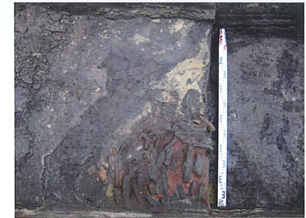
Fig. 1: Haard, opgebouwd uit tegels, aangetroffen bij het proefonderzoek op de hoek van de Zwaanstraat en de Putstraat in Torhout.

In 2009 startten grootschalige infrastructuurwerken op de Graanmarkt en in de aanpalende straten. Het plaatsen van nieuwe rioleringen ging gepaard met de heraanleg van allerlei nutsleidingen en vormde voor de stad Ninove meteen ook de gelegenheid om over te gaan tot een globale herinrichting en opwaardering van de Graanmarkt. Voorafgaand aan de werken werd daarom de westelijke helft van de Graanmarkt geëvalueerd met proefsleuven. De oostelijke helft van de Graanmarkt (de voormalige Varkensmarkt) werd niet aan een archeologisch vooronderzoek onderworpen aangezien eerdere infrastructuurwerken (collector