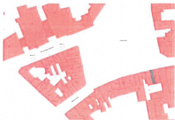
Fig. 2: Locatie van de proefsleuven.

De geplande werken zullen een groot deel van het bodemarchief onder de Korte Nieuwstraat roeren. Het Agentschap Onroerend Erfgoed adviseerde bijgevolg een prospectie met ingreep in de bodem om de eventuele aanwezigheid en bewaringstoestand van de site met walgracht en het kloosterkerkhof te evalueren. Hiertoe zijn in de zuidelijke helft van de Korte Nieuwstraat twee sleufjes aangelegd van ongeveer 2,5 m op 4,5 m (Pede et al. 2012): zone I (t.h.v. perceel 981F3) bevond zich vlakbij de Hopmarkt, zone II (t.h.v. perceel 981Z2) was dicht bij het Keizersplein gelegen (fig. 2).